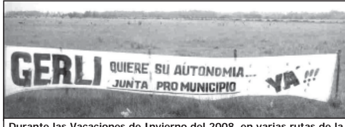
Durante las Vacaciones de Invierno del 2008, en varias rutas de la Provincia de Buenos Aires, se colocaron pasacalles por la Autonomía

Recordemos que el citado Proyecto de Ley para el Reconocimiento de Nuevos Municipios, presentado por el Diputado Julio César Alfonso durante 2005 y aprobado en junio de 2006, caducó al no ser tratado en el Senado durante el pasado año 2007 y renovarse la legislación. "No dudo que Diputados volverá a aprobarlo... sólo espero que esta vez lo traten los senadores", remarco Varani con entusiasmo.